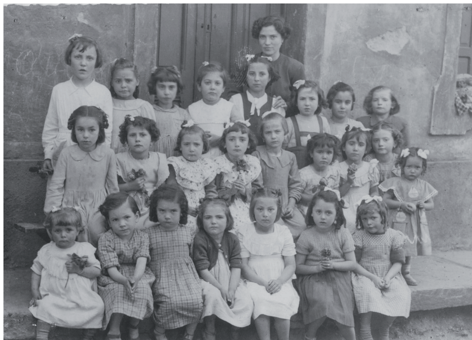
Lámina 8 Escuela de niñas de Agüeria, Aller, 1952.