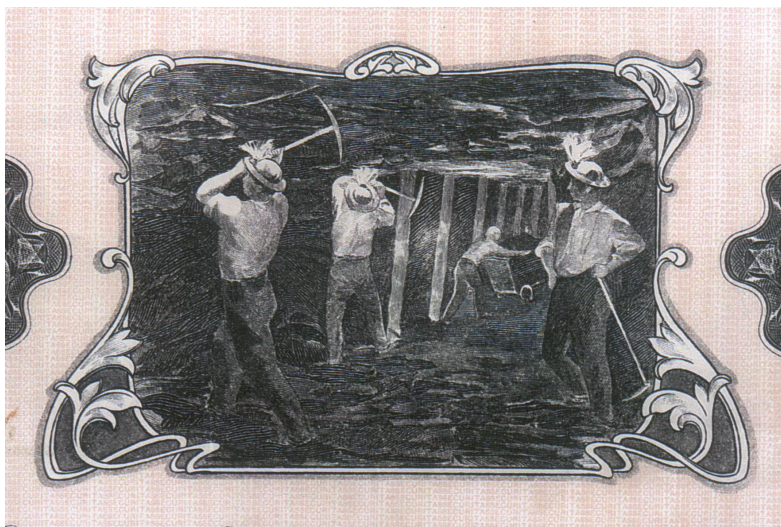
Lámina 5. Detalle de la acción de las Hulleras de San Martino, Pola de Lena Asturias, 1906. Las acciones de las compañías mineras asturianas son otra fuente de estudio privilegiada para profundizar la estética y usos laborales de la minería asturiana.

Nuestras dos sociedades mineras más decanas prosiguen su programa paternalista decimonónico en términos de vivienda obrera y, sobre todo, en cuanto a la habilitación de unidades escolares en las áreas más densamente pobladas. Auspiciadas por el Plan Nacional de la Vivienda se levantan las colominas de Oyanco dentro de un programa denominado de «mejora del habitat [sic] minero». 30 Las actas se hacen eco de estas cuestiones, 31 y en la sesión del día 19 de octubre de 1955 se aprueba «la construcción de dos unitarias y una de parvulos [sic] en el nuevo poblado de Oyanco y con cargo a la Sociedad Industrial (...)». La misma compañía vuelve a ser objeto de referencia el 6 de junio de 1962, cuando se pretende «graduar la enseñanza en Oyanco y edificar un grupo pues las escuelas están funcionando en locales habilitados al objeto. La Sra. Inspectora cuenta con el apoyo economico [sic] de la Sociedad Industrial a este objeto».