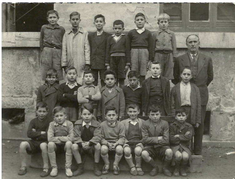
Lámina 7. Escuela Graduada de Cabañaquinta, capital del Concejo de Aller. Alumnos de segundo grado, 1955.

Al profundizar nuestra argumentación dentro del prisma actual, los profesores son ahora los encargados de transmitir a sus alumnos los conocimientos y saberes programados por niveles en el currículo escolar. Muy al contrario, la metodología propuesta por la dictadura franquista se afianzaba sobre criterios meramente memorísticos, sustentados sobre la repetición y la reiteración de unos conceptos vacuos y simplistas. De esta manera, la mayor parte de los estudiantes apenas progresaban en el sentido intelectual, quedando sus conocimientos estancados de un nivel a otro. El régimen se aseguraba así un alumnado disciplinado, acrítico, servil y profundamente ignorante en términos intelectuales, y eso a pesar de su alfabetización funcional que se prodigaba a la masa escolarizada.