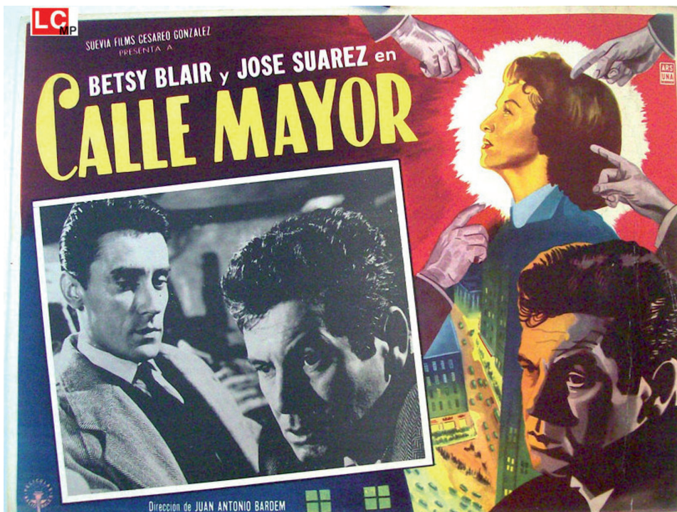
Lámina 4. Cartel de la película Calle Mayor.