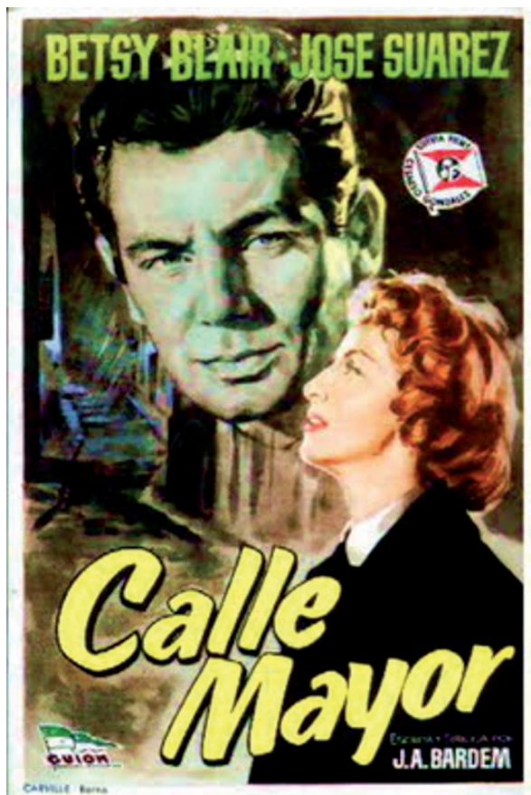
Lámina 3. Cartel anunciador de la película Calle Mayor , 1956, de José Antonio Bardem donde aparecen los dos protagonistas de la cinta.

Fuente: http://www.alohacriticon.com/elcriticon/article2594.html [Consulta: